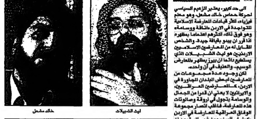
عنان الخليلين العربيين

المرحلة الاستطلاعية لصياغة تصورات... (A survey report detailing public opinion in Jordan regarding political leaders and opposition figures.)